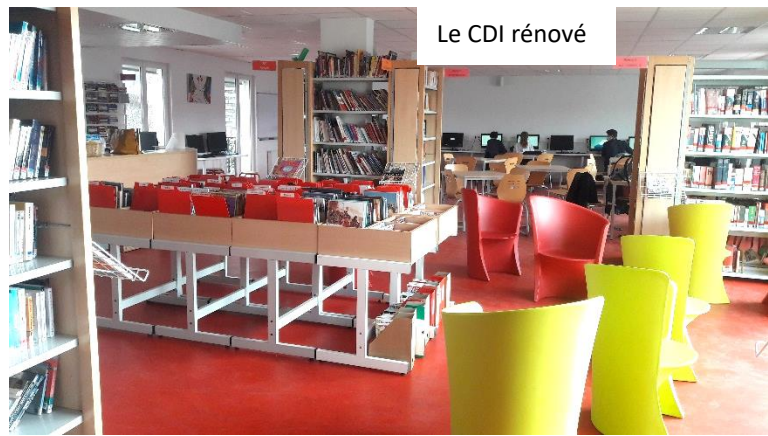
Le CDI rénové