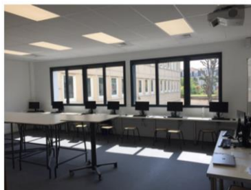
Une salle informatique